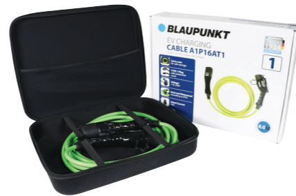
Alle laadkabels worden geleverd met doos en draagtas