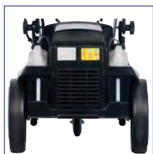
Watertoevoer en hogedrukaansluiting aan de voorkant, voor meer gebruiksgemak