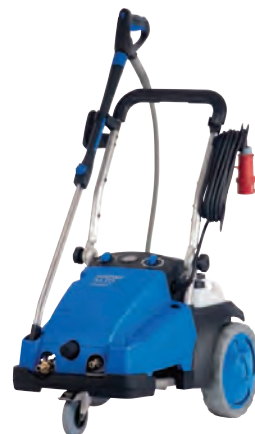
POSEIDON 6 & 7 Ook als levensmiddelen uitvoering leverbaar

Nilfisk-ALTO is onderdeel van Nilfisk-Advance, een van de voornaamste fabrikanten en leveranciers van professionele schoonmaakapparatuur ter wereld.