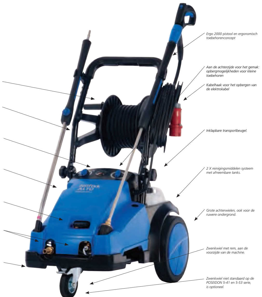
Ergo 2000 pistool en ergonomisch toebehorenconcept