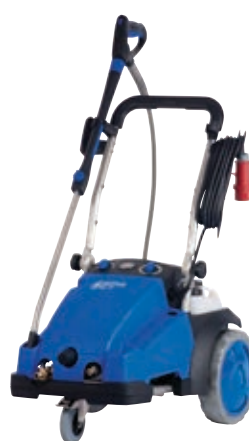
MC 7P FFA