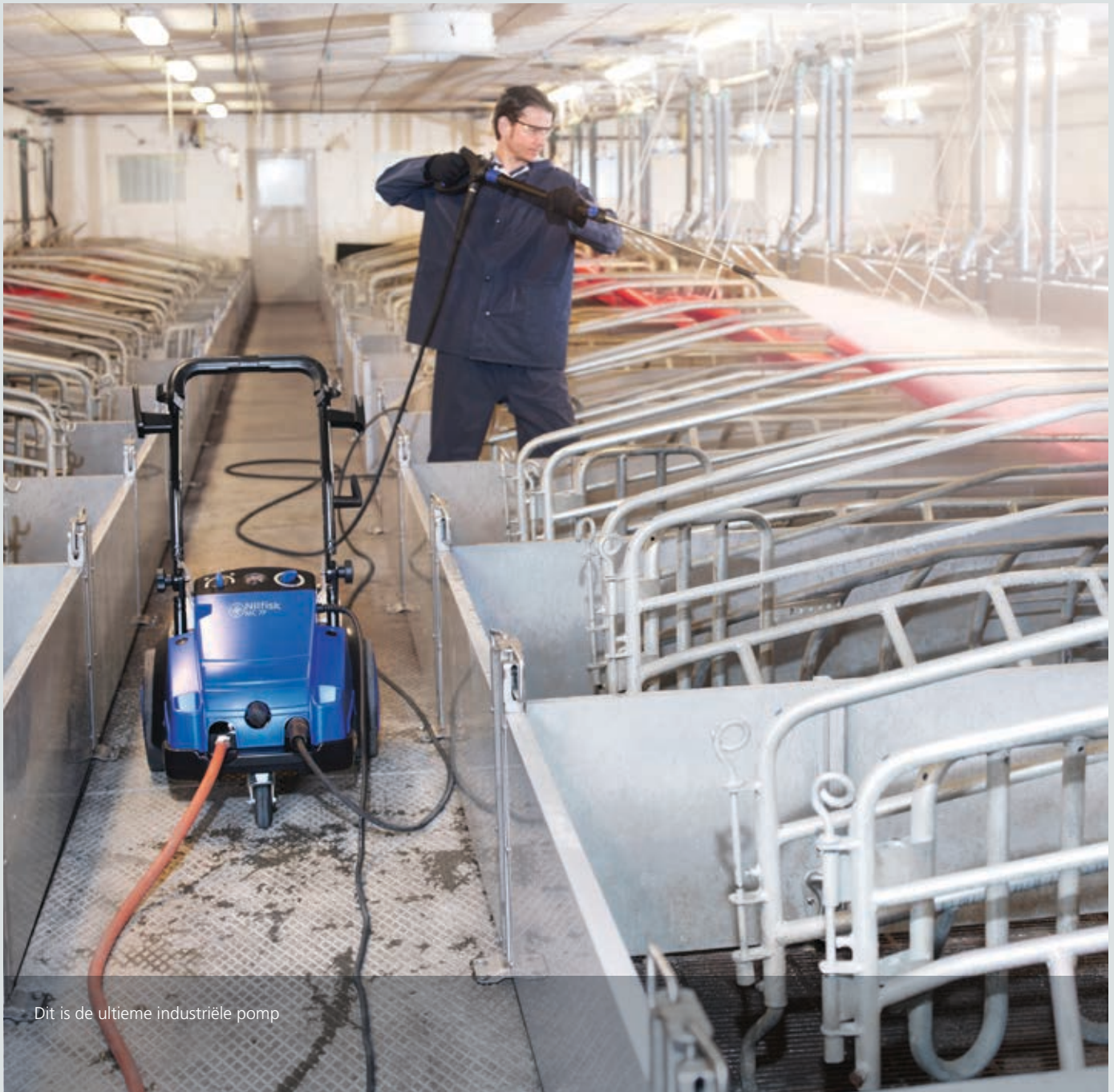
Dit is de ultieme industriële pomp