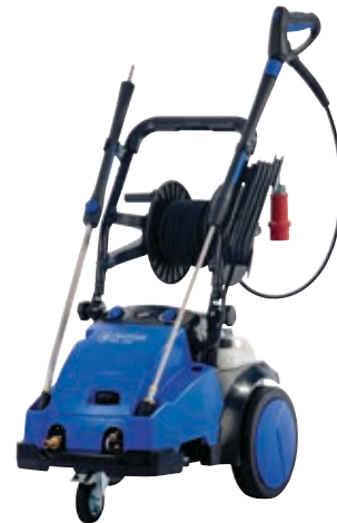
De MC 5M-200/1050 en MC 5M-220/1130 zijn verkrijgbaar met of zonder slanghaspel