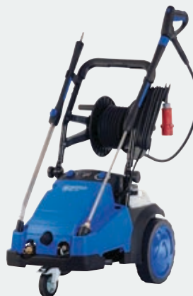
MC 7P / XT