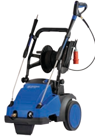
De MC 5M-180/840 en MC 5M-200/1000 zijn verkrijgbaar met of zonder slanghaspel.

De MC 5M-200/1050 / XT en MC 5M-220/1130 / XT zijn middelzware koudwaterhogedrukreinigers met extra functies voor bredere toepassingen en meer mobiliteit.