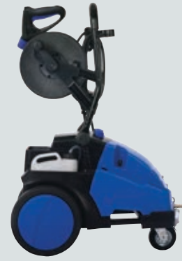
Verticale stand om te tillen

De handgreep kan worden ingeklapt om bij transport en opslag van de unit ruimte te besparen. Tevens kan de handgreep in een centrale positie worden geplaatst voor een optimale balans bij gebruik van een hijsstrop aan een hijskraan.