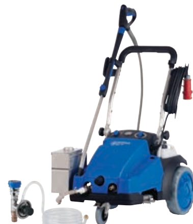
MC 7P FBFA met waterbuffertank en schuiminjector