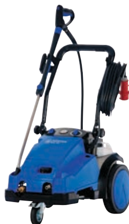
MC 6P FA - verkrijgbaar met of zonder slanghaspel, ook als FFA-versie.

Het MC 7P FBFA-model voor de voedingsmiddelenindustrie omvat een extra waterbuffertank en een externe reinigingsmiddelinjecteur die een volledige scheiding van het waternet garandeert en de mogelijkheid om schuim of speciale schoonmaakmiddelen te gebruiken.