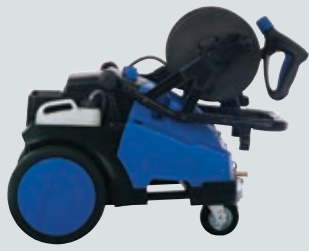
Transport - ingeklapte handgreep