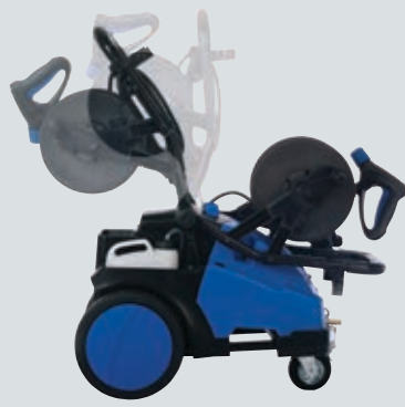
Alle 3 standen