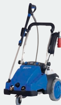
MC 7P FFA