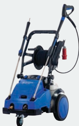
MC 5M / XT