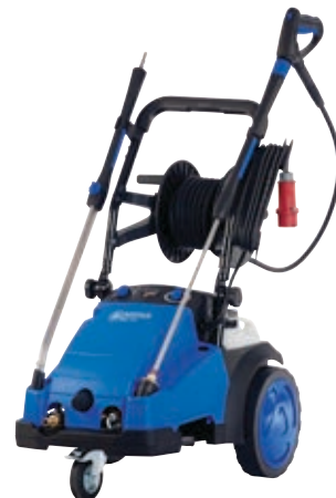
MC 7P FA - verkrijgbaar met of zonder slanghaspel, ook als FFA- en FBFA-versie.