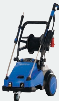
MC 6P / XT