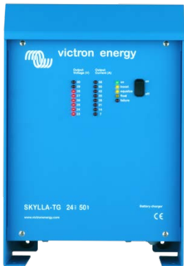
Skylla TG 24 50