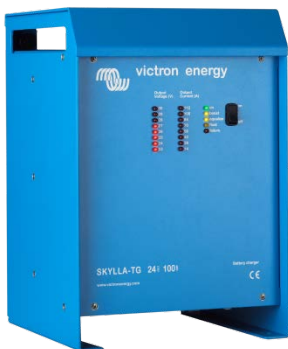
Skylla TG 24 100