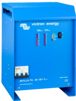
Skylla TG 24 50 3 phase

In ons boek 'Altijd Stroom' kunt u meer lezen over accu's en het laden van accu's (gratis verkrijgbaar bij Victron Energy en beschikbaar op www.victronenergy.com ).