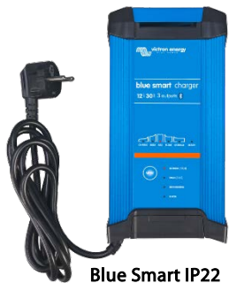
Blue Smart IP22 12/30 (3)