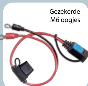
Gezeekerde M6 oogjes