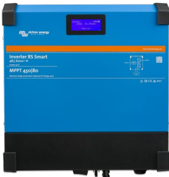
Omvormer RS Smart 48/6000